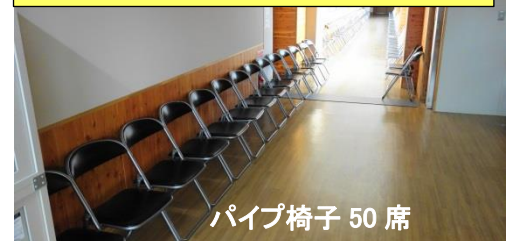
パイプ椅子 50 席