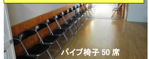
パイプ椅子 50 席

※身体的距離を確保します。 ※換気をしたままですので、防寒着の準備をお願いします。