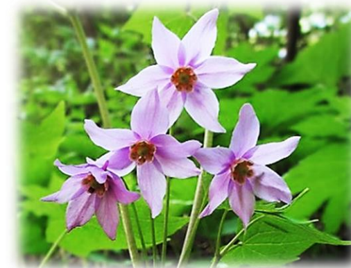
戸隠しようま 校歌に登場する花です。校章の デザインにもなっています。

◆参加希望者は、7月14日(金)~9月13日(水)までに必ず事前申込をしてください。