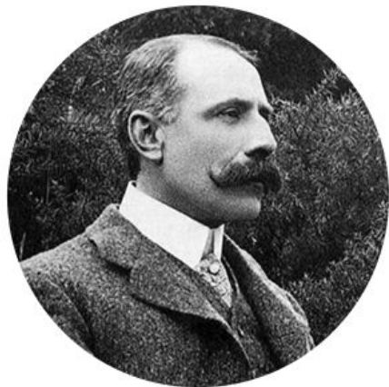
Edward William Elgar