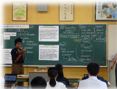
ALTの感想を共有している様子