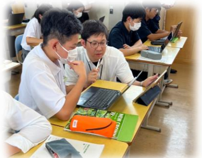
書き直しをしている様子