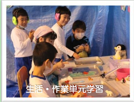
生活・作業単元学習

本校では、特別支援教育に関わる多くの先生方（特別支援学校の先生方、特別支援学級の先生方、通常学級の先生方）と授業について意見・情報交換をしたり、授業づくりについて学び合ったりする機会を設けたいと考え、「学びのワークショップ」を開催しています。ぜひ、ご参加ください。