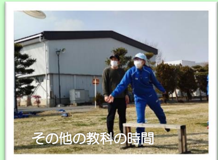
その他の教科の時間