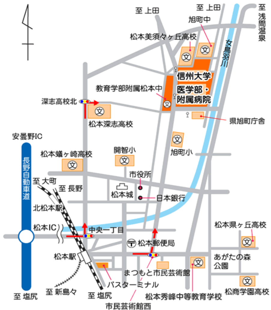
信州大学医学部附属病院 周辺地図