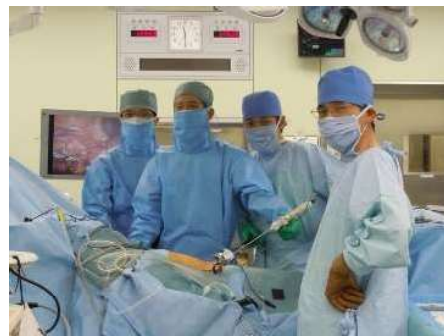
名古屋大学での手術トレーニング