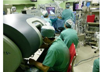
Da Vinci 手術