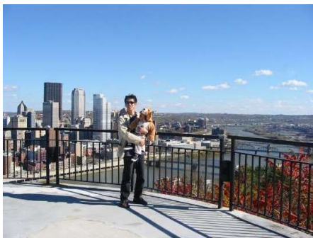
ピッツバーグでの生活

Lund大学(スウェーデン) Copenhagen大学(デンマーク) Virginia大学(アメリカ) Pittsburgh大学(アメリカ) McGill大学(カナダ) Mayo Clinic(アメリカ) Texas A&M大学(アメリカ) Antwerpen大学(ベルギー) 名古屋大学